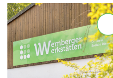
Kreativgruppe „Tag der offenen Tür“