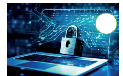
Sicher im Internet unterwegs