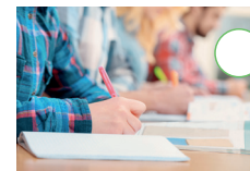
Deutsch 2 - Rechtschreibung