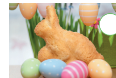
Backen zu Ostern