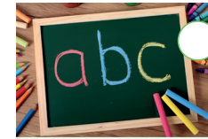
Deutsch 1 - Lesen und Schreiben üben