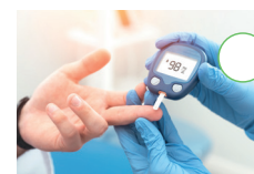
Umgang mit Diabetes